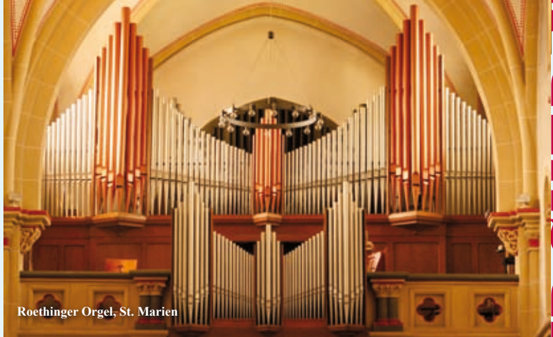
Roethinger Orgel, St. Marien