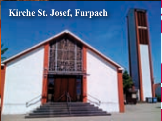
Kirche St. Josef, Furpach