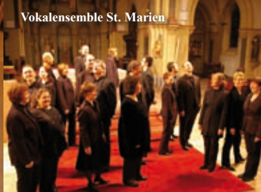
Vokalensemble St. Marien